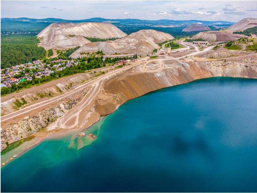
Mines et ressources naturelles □