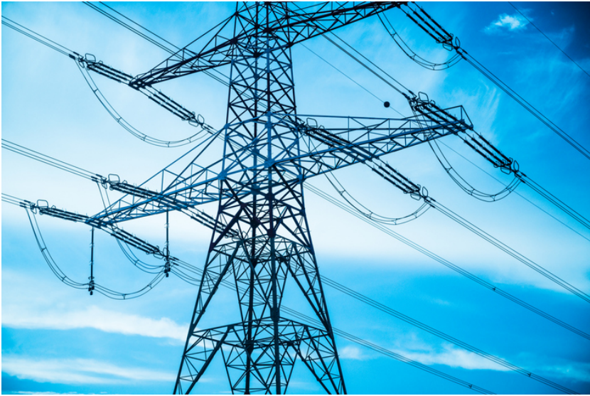
Électricité et services publics □